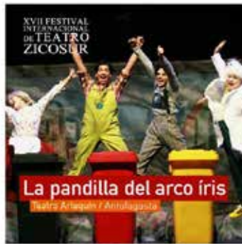
20.00 hrs Parque Croacia