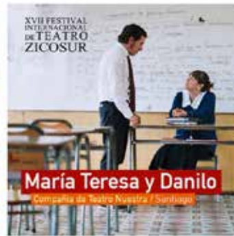
22.00 hrs Parque Croacia